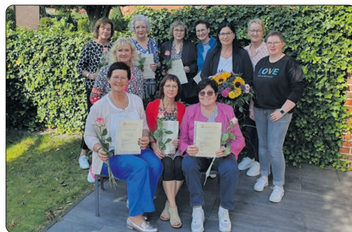
Die ehrenamtliche Hospizarbeit hat acht neue ehrenamtliche Mitarbeiter gewonnen.

„Für eine würdevolle Begleitung am Lebensende ist es wichtig, sich auf offene Gespräche und Bedürfnisse des Sterbenden einzulassen, Zeit zu haben, gern den Umgang mit Menschen pflegen, sich mit Themen wie Sterben und Tod auseinan-