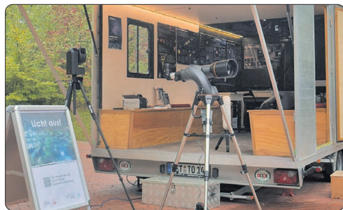
Zwei Wochen steht das „Tiny Observatorium“ vor dem Alten Rathaus in der Sevelter Straße.

Cloppenburg Ein „Tiny Observatorium“ – eine mobile Sternwarte mit einem leistungsfähigen Profi-Teleskop, mit dem auch Laien einen faszinierenden Blick in den Weltraum werfen können – steht für zwei Wochen vom 22. Oktober, bis zum 12. November auf dem Platz vor dem alten Rathaus in der Sevelter Straße in Cloppenburg. Die Sternwarte kann während der Öffnungszeiten ohne Anmeldung kostenlos besucht werden. Die Carl-von-Ossietzky-Universität Oldenburg und die Ländliche Erwachsenenbildung in Niedersachsen (LEB) haben das Wissenschaftsmobil aufgebaut. Zusammen mit der katholischen und der evangelisch-lutherischen Kirchengemeinde, der Volkshochschule und dem Bildungswerk hat die Stadt Cloppenburg das Astronomie-Projekt „on Tour“ in die Kreisstadt geholt. An fünf Tagen lädt das wissenschaftliche Team alle Interessierten ein, durch das hochwertige Teleskop den