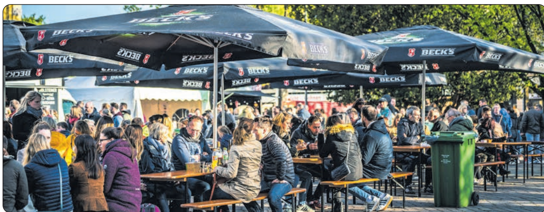
Viele Gäste erhoffen sich die Veranstalter auch in diesem Jahr zum Streetfood-Festival in Emstek.

Neben dem großen Foodbereich mit Foodtrucks aus ganz Norddeutschland gibt es Live-Musik und einen Bereich speziell für Kinder. Das Festival bietet eine breite Auswahl an Food-Trucks, die sowohl beliebte Klassiker als auch seltene kulinarische Spezialitäten präsentieren. Besucher können sich an allen drei Tagen von internationalen Leckereien und Finger-Food verwöhnen lassen, darunter Burger sowie indische, afrikanische und spanische Spezialitäten und natürlich noch etwas