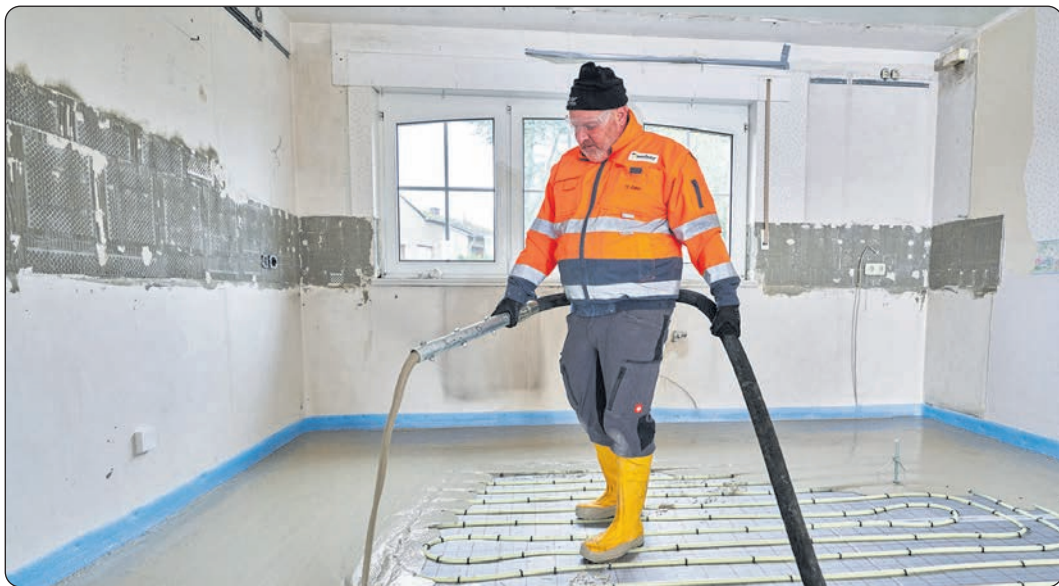
Moderne Dünnschichtsysteme eignen sich auch für Altbauten.

Da die Heizungsrohre sehr nah unter der Oberfläche verlegt sind, zeichnet sich das Dünnschichtsystem durch sehr kurze Aufheizzeiten aus. Auch deswegen kann die Vorlauftemperatur meist noch weiter abgesenkt werden - beides senkt