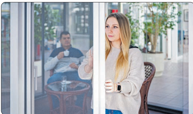
Wintergärten bieten ein Extrazimmer zum ganzjährigen Wohlfühlen.

Der individuelle und passgenaue Bau eines beheizten Warmwintergartens ist deutlich aufwändiger als der eines Kaltwintergartens. Dafür bietet er einen Komfort, der mit anderen Räumen des Hauses vergleichbar ist - vorausgesetzt, er wurde fachgerecht errichtet, gut isoliert und verfügt über eine Lüftung und eine Verschattung, die ein übermä-