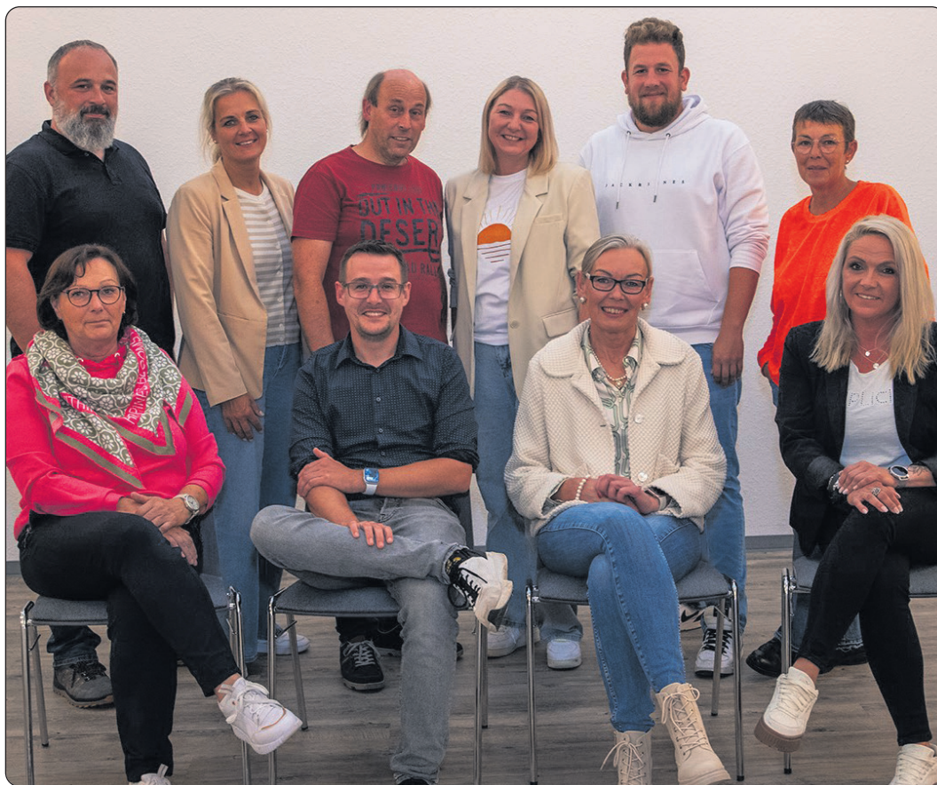
Die Theatergruppe der Kolpingfamilie Cappeln freut sich auf die Premiere ihres neuen Stücks im November.