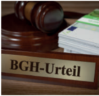
Starkes Urteil für Versicherte.

Bei einem Widerruf erhalten Sie – anders als bei der Kündigung – alle eingezahlten Beiträge ohne Abzug von Maklerprovisionen und Verwaltungskosten zurück. Und nicht nur das: Die Versicherung muss Sie auch an dem mit Ihrem Geld erzielten Anlagegewinn beteiligen. So können Sie bis zu 150 % der eingezahlten Beiträge zurückholen. Ein sattes Plus auf Ihrem Konto winkt!